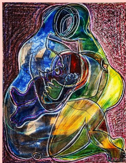
Madre e hij@ (2008, 50x65) - Foto: Jens Winkler