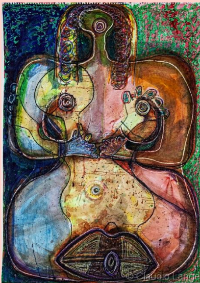
Madre e hij@ (2010, 69x97)